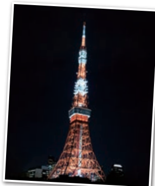
東京タワー (画像はイメージです)