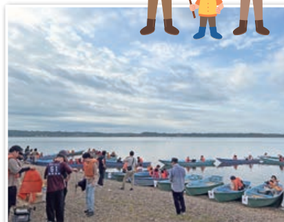
(画像はイメージです)

※釣竿・仕掛け(リール・オモリ・釣り針等)は持参してください。 釣竿の貸出しはありません。