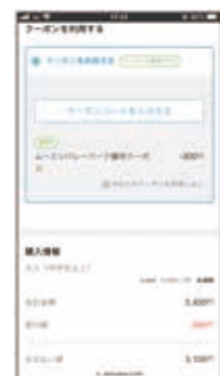
クーポン適用後、割引価格 が適用されている事を 確認の上ご購入ください。