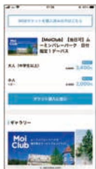
チケット購入に進む