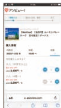
利用日と購入枚数を選択