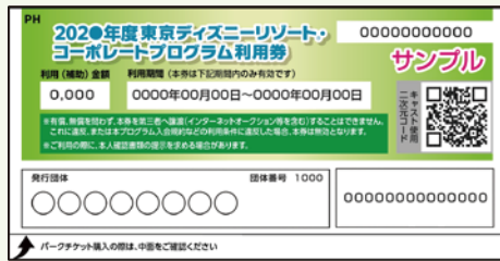
コーポレートプログラム利用券

東京ディズニーランド®/東京ディズニーシー®のパークチケットの購入やディズニーホテル宿泊にご利用いただける利用券です。