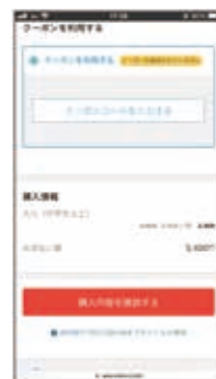
クーポンコードを入力 ※購入者情報を入力 すると表示されます。