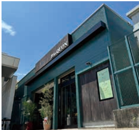
(画像はイメージです)