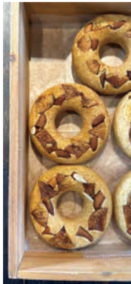
(画像はイメージです)