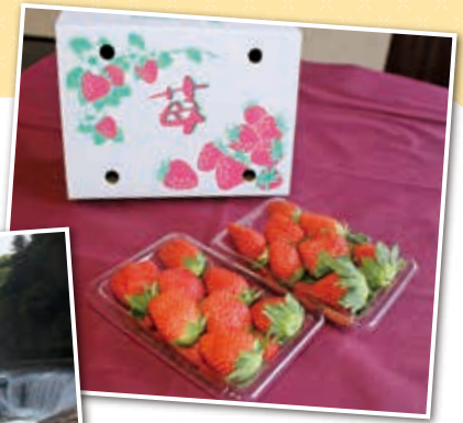
(画像はイメージです)