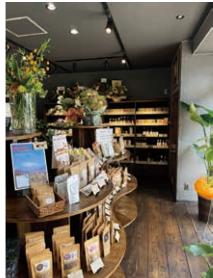
(画像はイメージです)