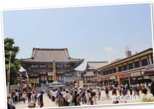
川崎大師(イメーシ)

各地～守谷 SA(8:00 頃)～川崎大師(参拝)～ 横浜中華街 重慶飯店(オーダー式ランチバイキング)～ 守谷 SA(17:30 頃)～各地